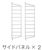
サイドパネル × 2